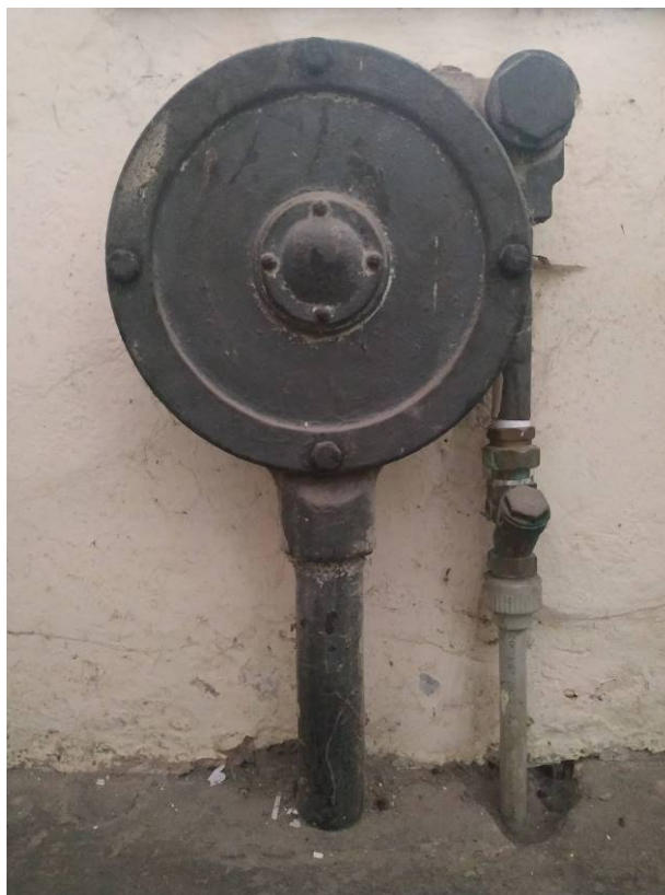
SPR01.04.02 Zvon – vnitřní část