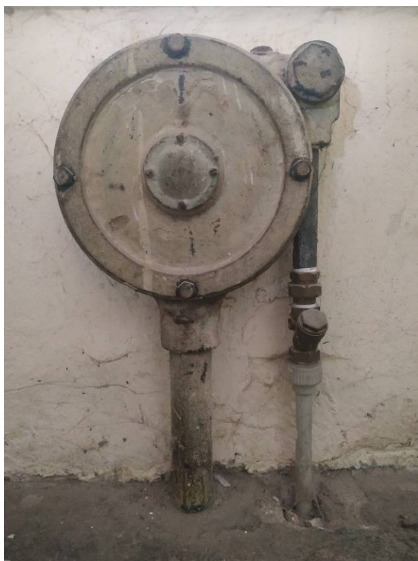
SPR01.03.02 Zvon – vnitřní část