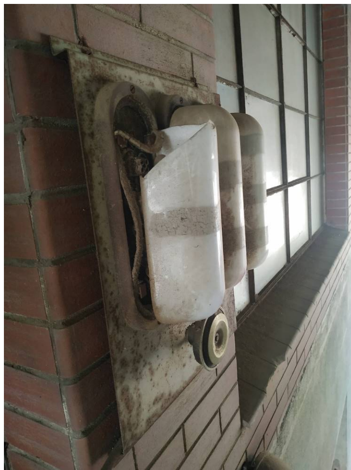
SPR01.02 Světelná signalizace