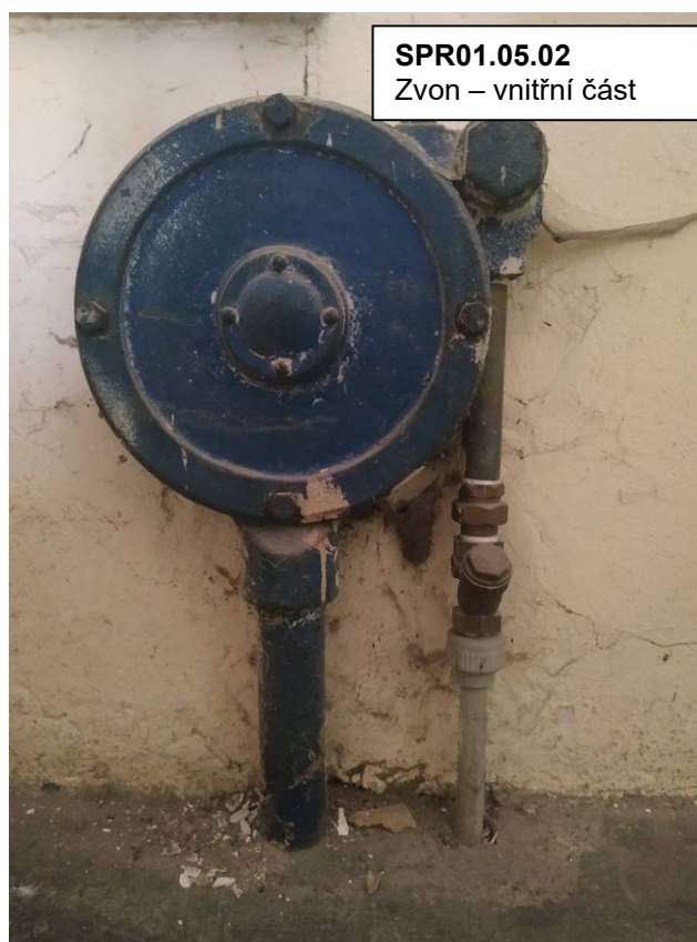
Detailní pohled na SPR01.05.02 Zvon – vnitřní část